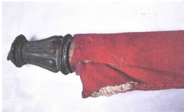
Bild 3. Provisorisk ihopsnöring av strumpan